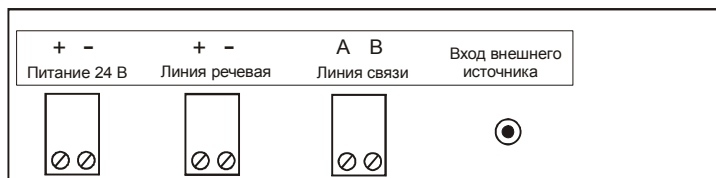
Схема подключения БМ